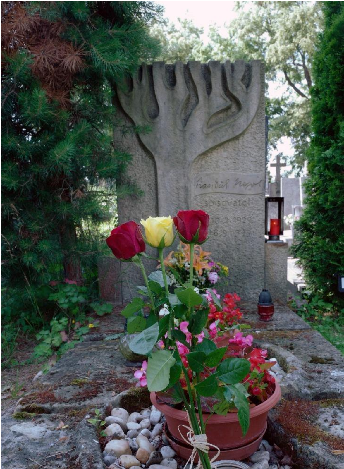
Hrob Budulína s květinou (dodal Přemík ) v barvách Pětky