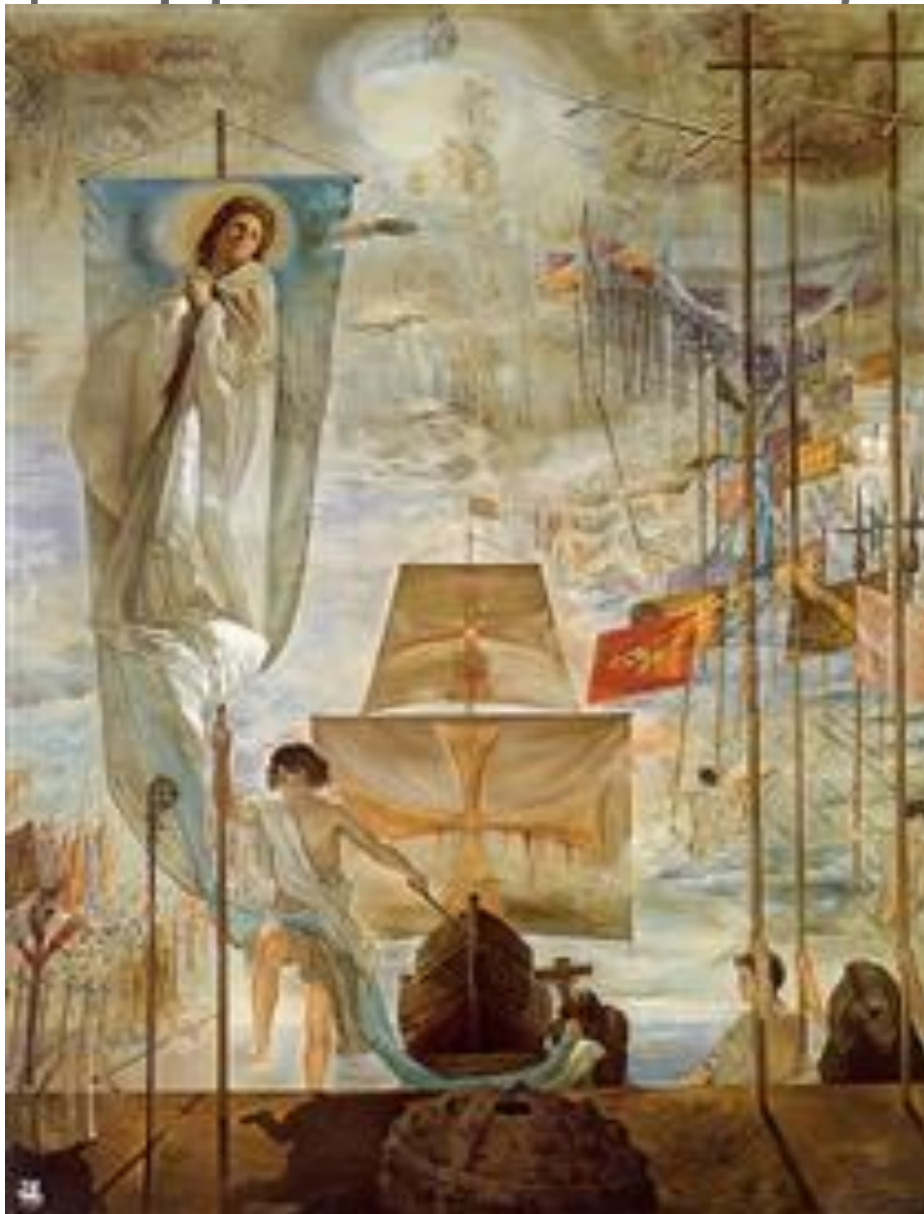
Salvador Dalí: The Discovery of America by Christopher Columbus (1958-1959)