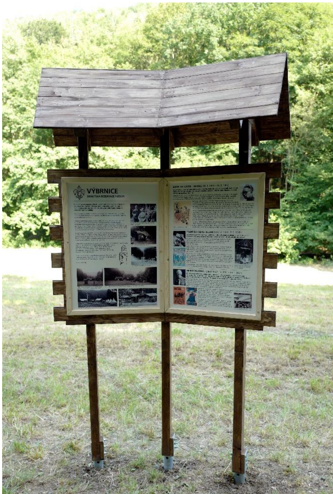
U příležitosti tábora byla odhalena informační deska, kterou vyrobil Foki a naplnil ji Reyp informacemi jak o místě u Výbrnice, tak o Bratřovi a Pětce .